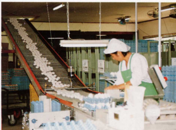
卵をパックづめしている