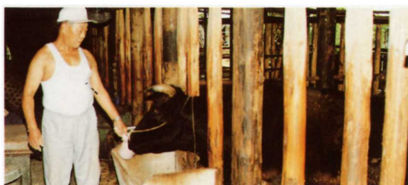
えさをもらっている牛

牛は60頭います。子牛を育てて売りに出したり、うまれた子 牛を売ったりします。牛のえさは、トウモロコシやほし草です。 トウモロコシは、輸 ゆ 入 にゅう したものを使 つか います。