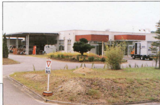
⑥ ⑥パソコンの部品などをつくる工場 かんとうせいこう (関東精工)