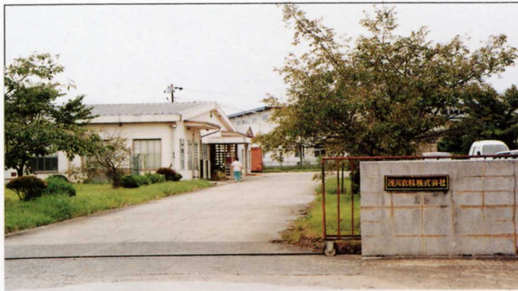
④ ④ふくをぬう工場 (浅川衣料) いりょう