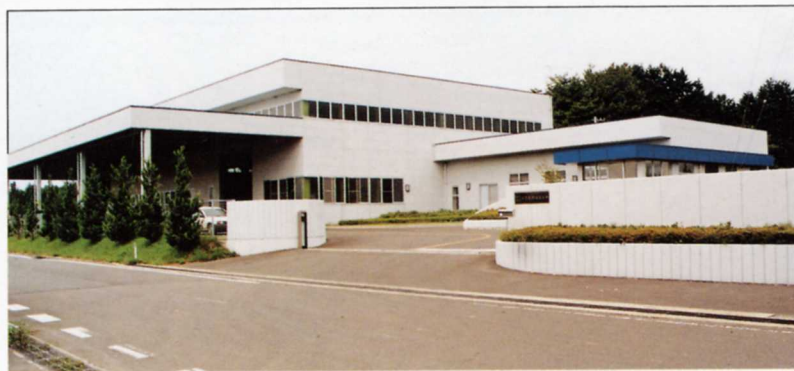
⑤ ⑤いろいろな機械の部品をつくる工場(和光精機) わこうせいき