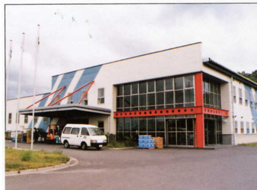
⑦ ⑦自動車のエアコンなどをつくる工場(ニッセイ)