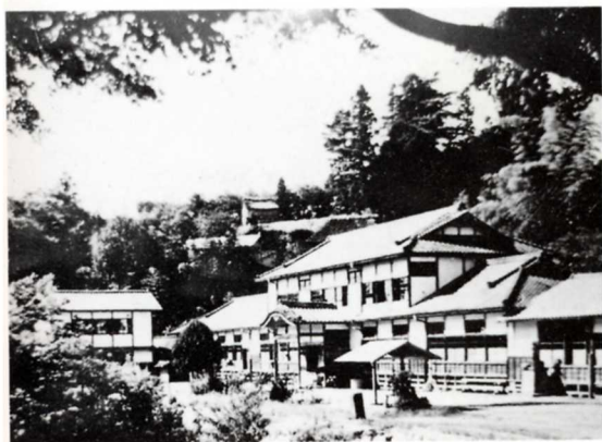
むかしの山白石小学校(昭和13年ごろ)