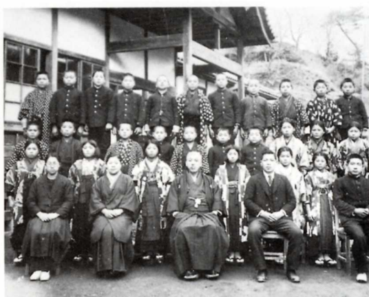
むかしの小学生と先生方 (昭和のはじめごろ)

わたしたちの学校ができたころ、どんなできごとがあったのでしょうか。しらべてみましょう