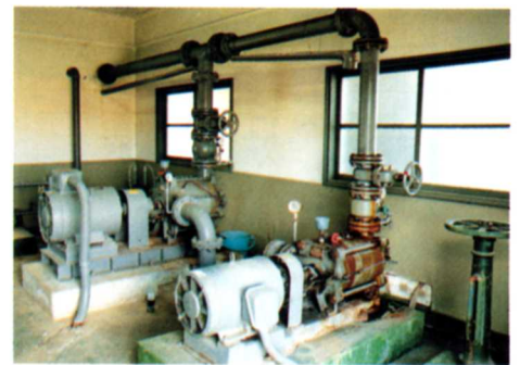
きれいになった水を送る