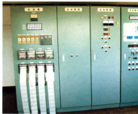
水の流れを調節したりする機械