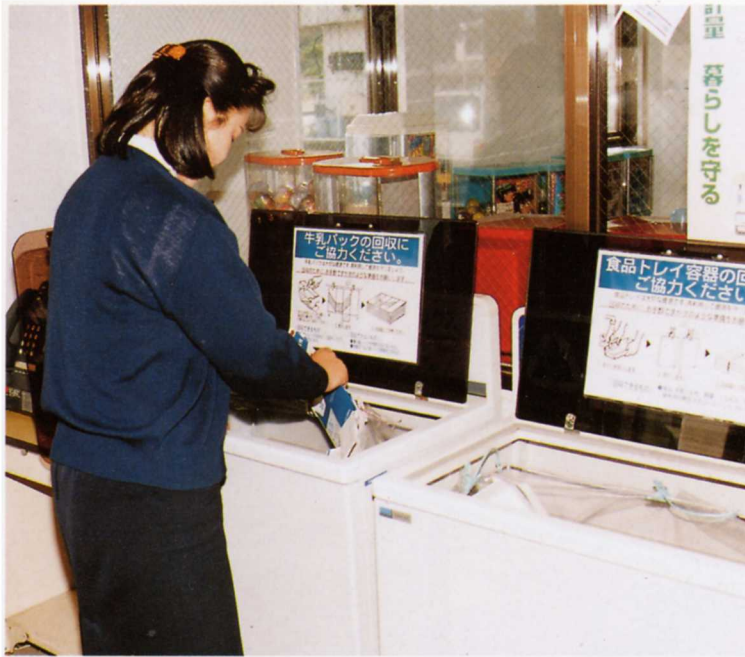
スーパーマーケットでの牛乳パック、食品トレイの回収の様子