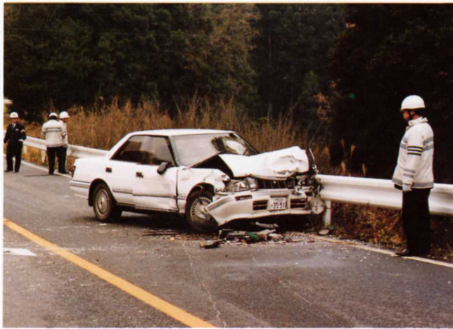
たいは 事故で大破した車