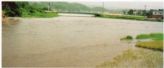
大水でかん水した田畑