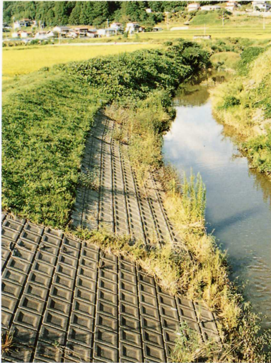
川とていぼう（殿川）