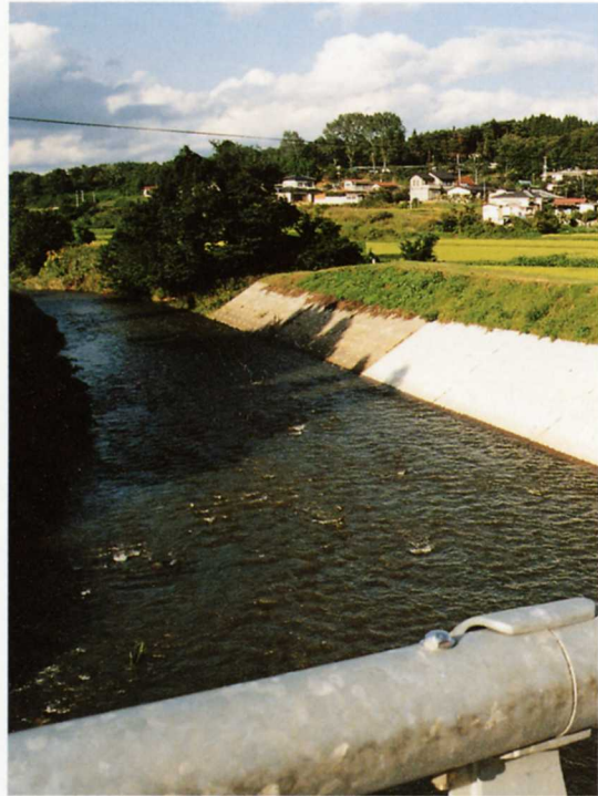
消波ブロックをしくめておく社川