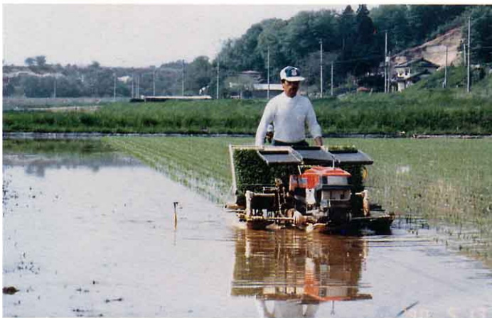
きかいで田うえをする

さいきんは、6条うえなど大がたのきかいでうえますが、小さい田は手でうえています。