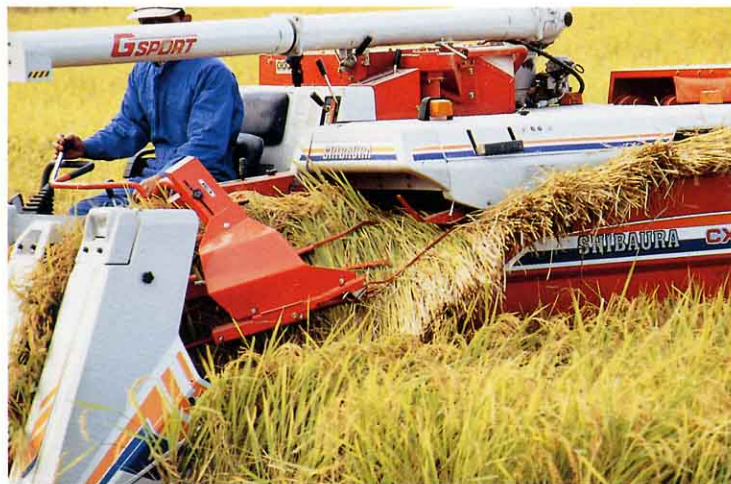
きかいでいねかりをする