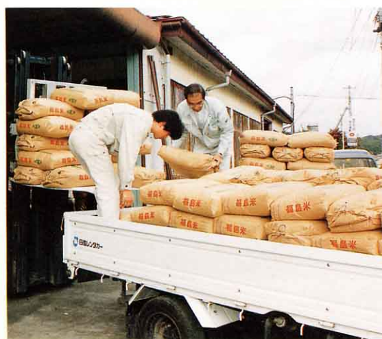
そうこ 倉庫におさめられる米