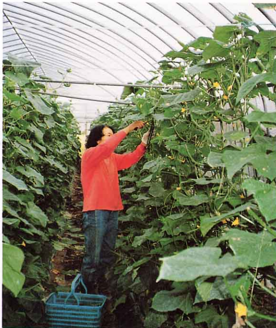
キュウリをとっている