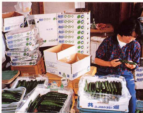
キュウリをそろえる