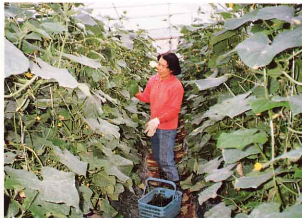
とったキュウリをかごに入れる