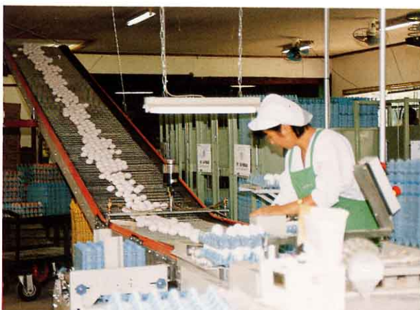
卵をパックづめしている