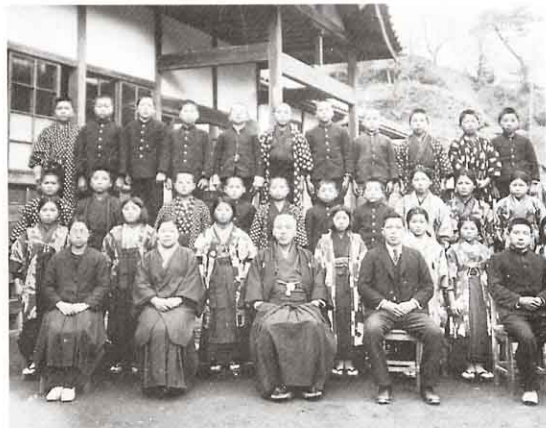
むかしの小学生と先生方 (昭和のはじめごろ)

わたしたちの学校ができたころ、どんなできごとがあったのでしょうか。しらべてみましょう