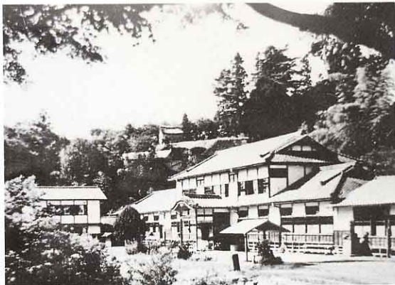
むかしの山白石小学校(昭和13年ごろ)