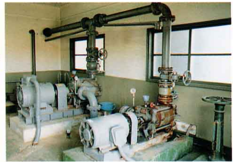
きれいになった水を送る