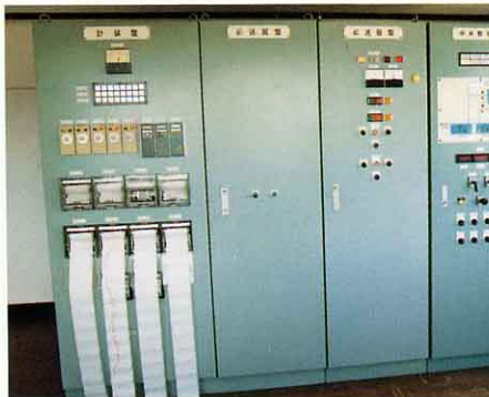
水の流を調節したりする機械