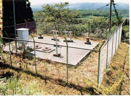
いろいろなところへ水を送る建物