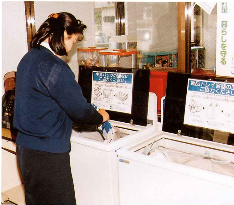
スーパーマーケットでの牛乳パック、食品トレイの回収の様子