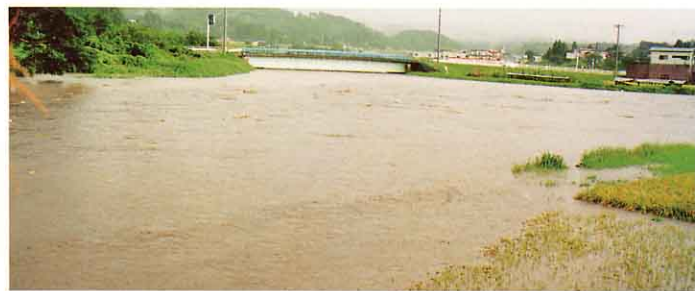
大水でかん水した田畑