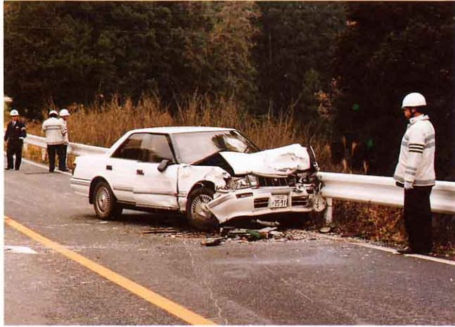
たいは 事故で大破した車