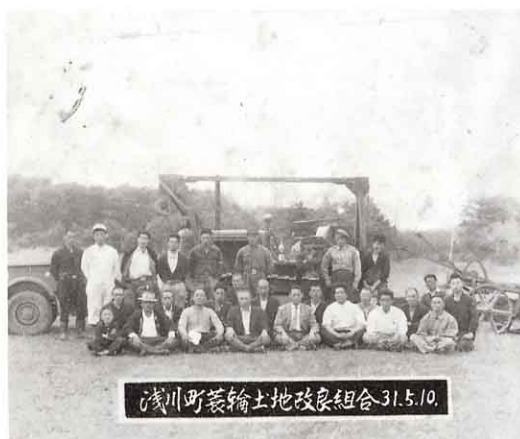
水田作りに使われた機械のセミクローラー