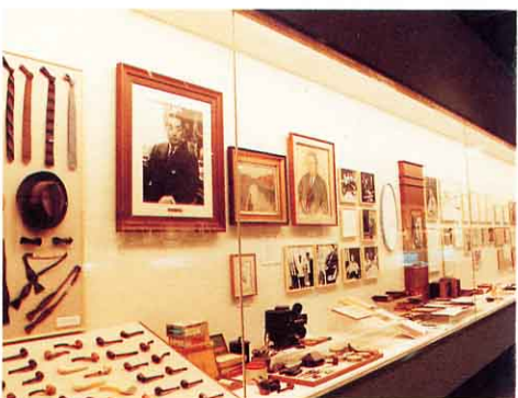
吉田富三記念館のなか