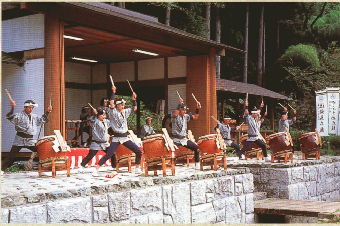
流鏝馬太鼓 八幡神社例大祭の本祭りに行われる勇壮な流鏝馬太鼓の響きは、流鏝馬神事の重厚さを増し、気運を盛り上げる。