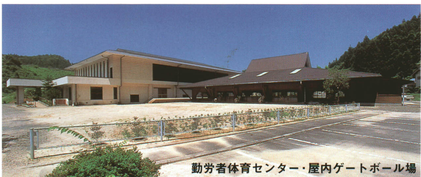
勤労者体育センター・屋内ゲートボール場