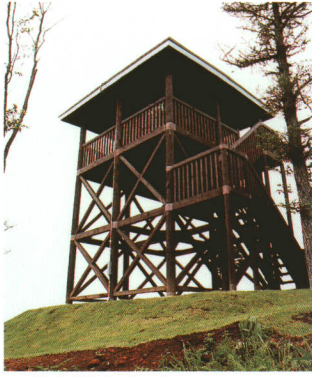
三株山頂富士見台