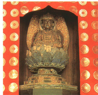
西光寺・木造阿弥陀如来座像