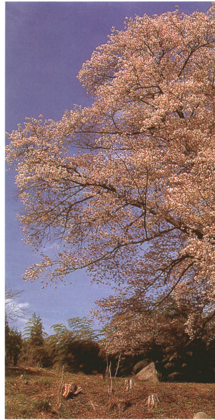
大久田越代のサクラ

越代のサクラは樹齢400年、高さ20mのヤマザクラの古木で、県の天然記念物に指定されています。4月の下旬になると淡いピンクに染まり、夜にはライトアップされます。