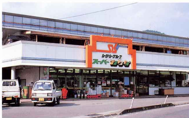
スーパーマーケット