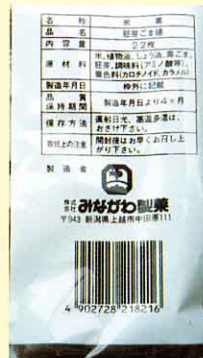
せんべいとラベル