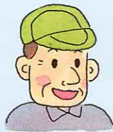
牛をかって のうか いる おじさんの話

いい牛にゅうが出るように、えさもくふうしてあたえているんだよ。きかいをつかってしぼってるよ。牛にゅうがわるくならないようにひやしておくんだよ。