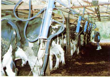
きかいでちしぼりをする