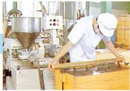
形になったものをカットする