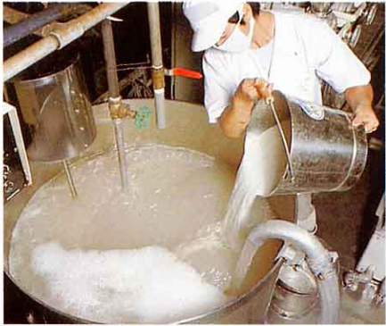
こなとお湯をまぜてのりかきにする