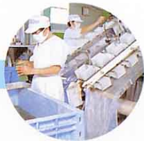
水をいれてほうそうする