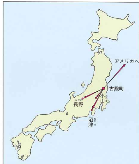
せいひんのおくり先