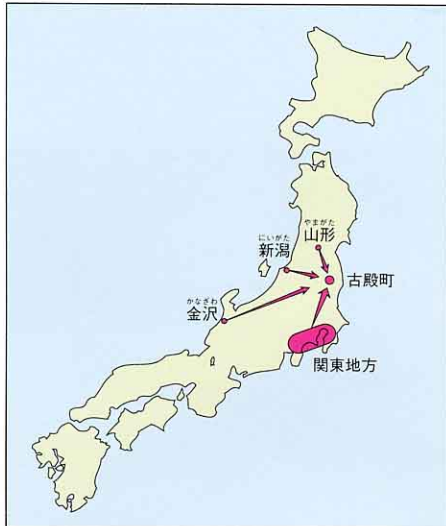
げんりょうのしいれ先