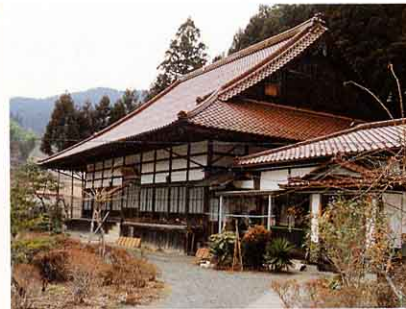
学校のかわりをしていたお寺