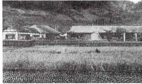
むかしの田口小学校