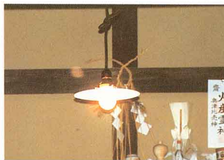
はつねつでんきゅう 白熱電球