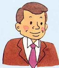
センターのおじさんの話

ふるさとセンターは、古殿町におかしからある のうぐ 農具や毎日の生活でつかわれていたものを、大切に ほぞん 保存しています。