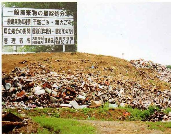
もえないごみのしり場（下山上の長草）