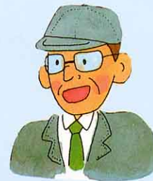
水道係のおじさんの話

わたしたちの飲む水は、 かまた 鎌田を流れる さわがわ 沢川から取り入れられています。そのほか、町の こうみんかん 公民館や けんこうかんり 健康管理センター近くの地下水からも取り入れられています。