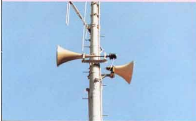
よびかけをながす防災無線