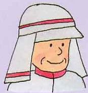
消防団のおじさんの話

消防団の本部は、町役場にあります。また、地区ごとに分団があります。消防団員は、ふだんはさまざまな仕事をしていますが、火事が起きるとすぐにかけて消火にあたります。出動にそなえて、日ごろからポンプ そうぼう 操法のくんれんなどを行っています。