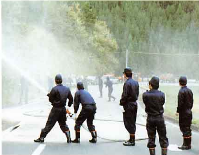
消防団のくんれん