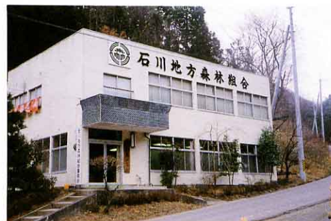
森林組合の事務所

山に苗を植えるのをすす めたり、植え方や育て方や 手入れのし方の指導をした りします。