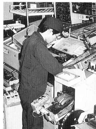
ブレーキのききぐあいをきかいでしらべる