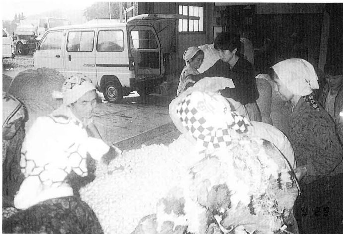
まゆのしゅっかのためのさぎょうをする