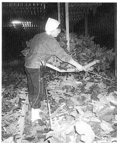
1日2~3回、かいこにくわの葉をかける