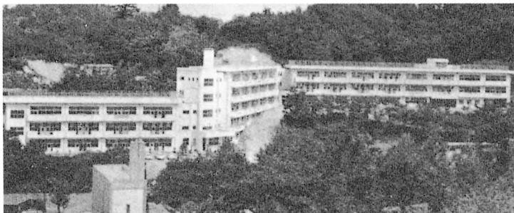
25年ぐらい前の学校（昭和45年）