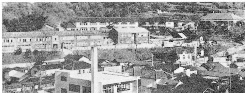
50年ぐらい前の学校（昭和25年）