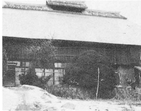
「けむり出し」 いろりて木をたいたときのけむりを 出すところ。