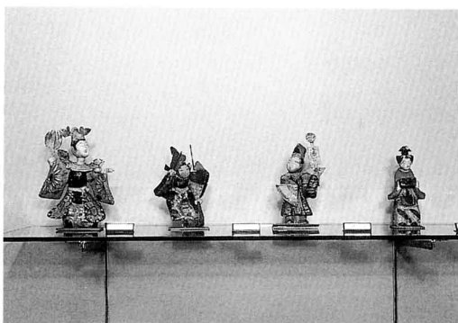
みはるにんぎよう ▲三春人形