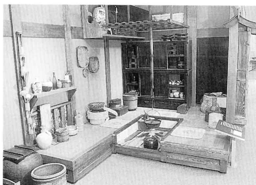
のうか ▲農家のいろりばた

「きのうの三春」と「はるかな三春」にわけて展示されています。 また、三春町には、人形や郷土玩具が展示されている「三春郷土人形館」があります。