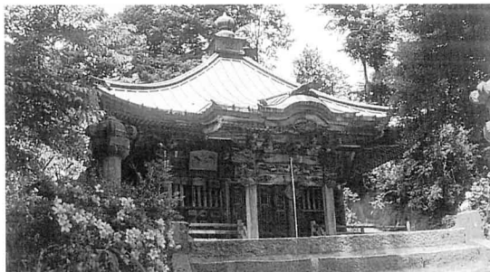
馬頭観音堂 はとうかんのんどう