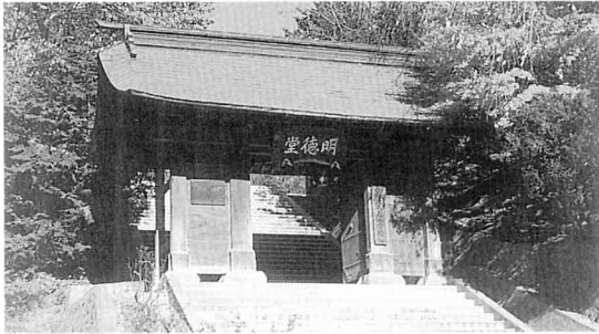
三春小学校の校門「藩講所表門」 こうもん はんこうじょおおもでもん