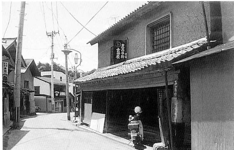
「道場町」の通り「職人横丁」とよばれている どうじょうまち とお しょくにんよこちよう