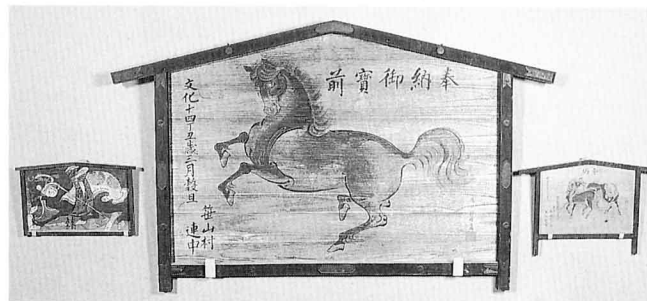
けんさんひつ おおえま 研山筆 大絵馬