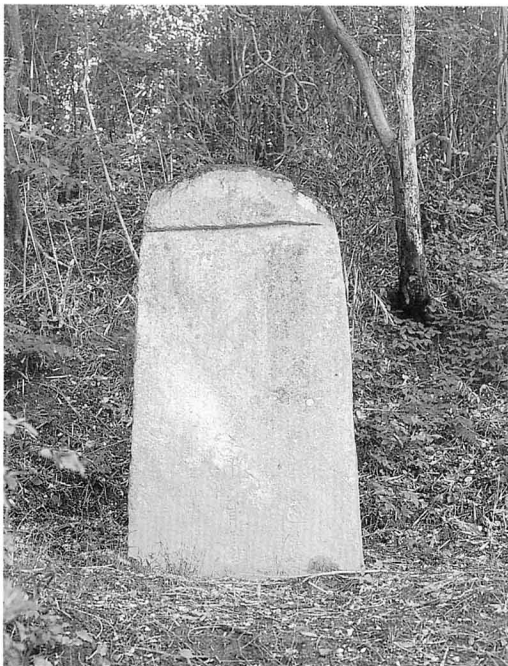
こうあん いたひ 弘安の板碑