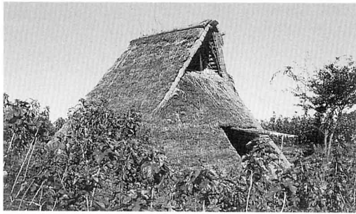
どうだいらいせきふくげんじゆうきよ 堂平遺跡復元住居