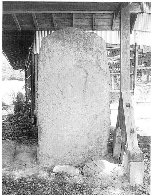
おうちよう いたひ 応長の板碑