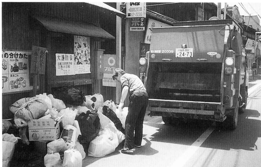
—ごみしゅうしゅう車で集められるごみ—