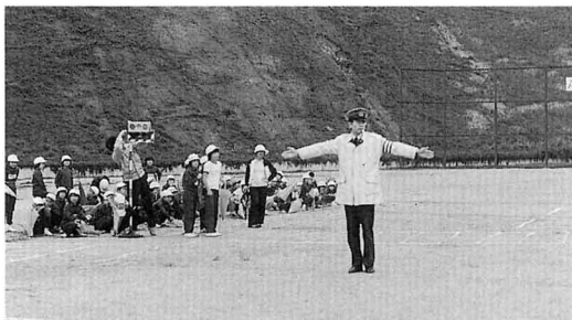
けいさつの人による交通教室