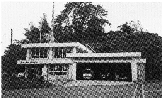
船引消防しよ三春分しよ

(はたらく人 12人 ポンプ車1台 きゅうきゅう車1台 こうほう車1台 その他1台)