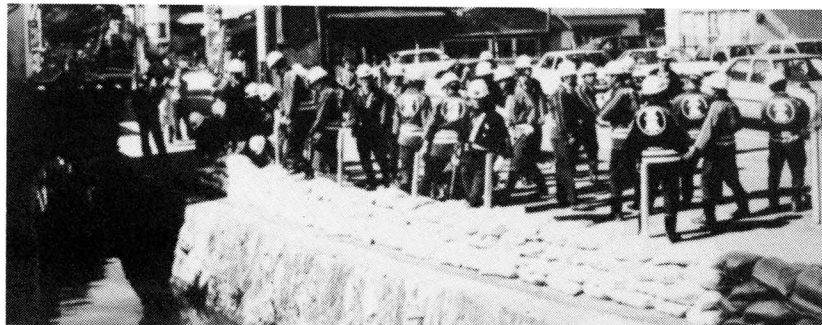
桜川 (三春地区内大町)

大雨による田畑や家などにひ害をおよぼさないように、土のうづくりや土のうづみなどの防水くん練が行われている。