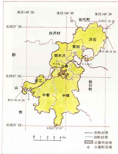
三春町の位置と範囲

西部の岩江地区の高度は、約230mで最も低く、最も高い所は、北東部の沢石地区にある念佛壇で510.7mである。その差は約280mであり、多くの川は北東から南西へ流れ出している。