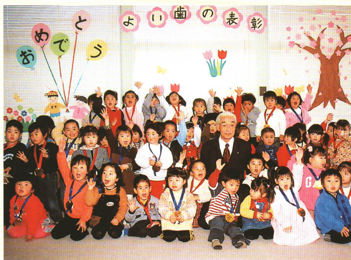
▲3歳児 よい歯の表彰式