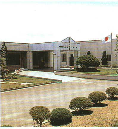
特別養護老人ホーム こまち荘