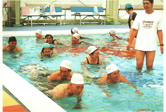
▲高齢者の水泳教室