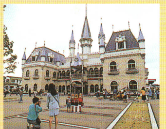
リカちゃんキャッスル