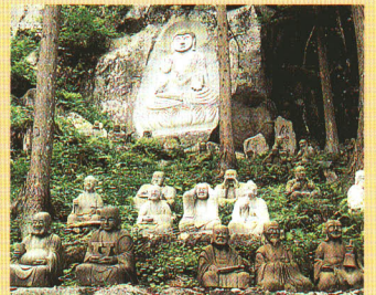
東堂山の昭和羅漢