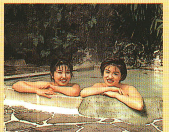
小町温泉・湯沢温泉